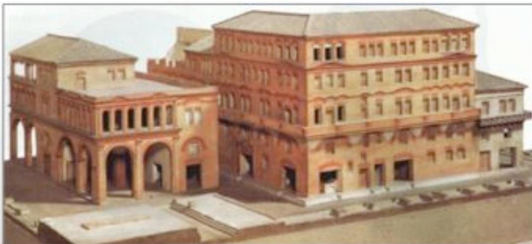
Típica insulae : casa de apartamentos de alquiler